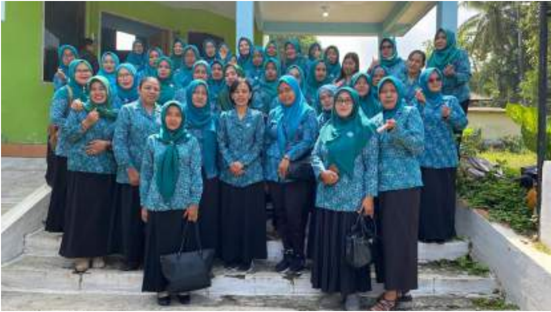
Pertemuan Rurin PKK se kecamatan kesamben