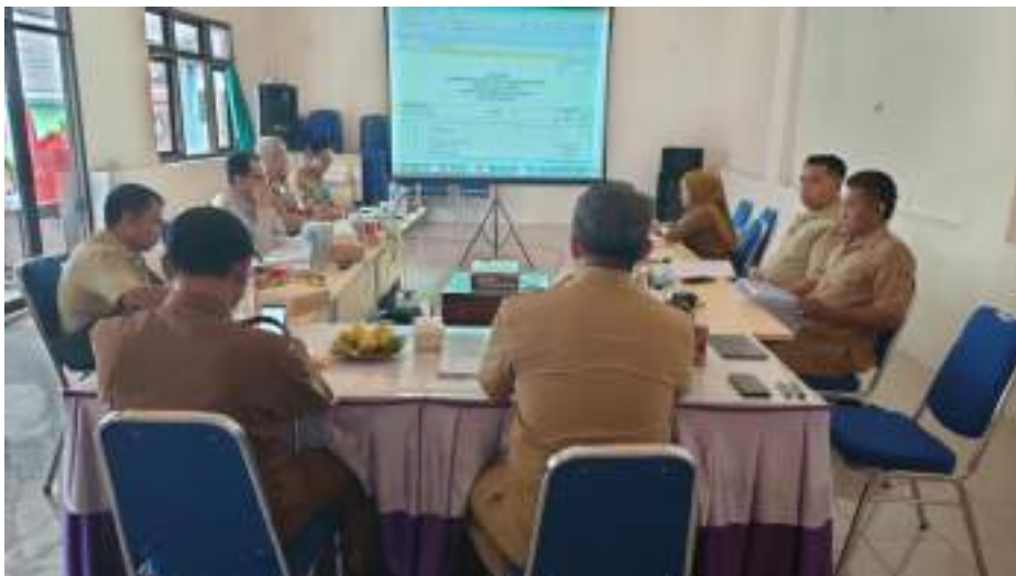
Evaluasi APBDes Perubahan