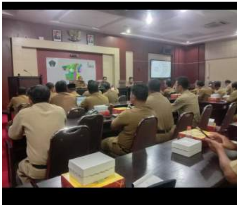
Asistensi penyusunan Renstra 2025- 2029