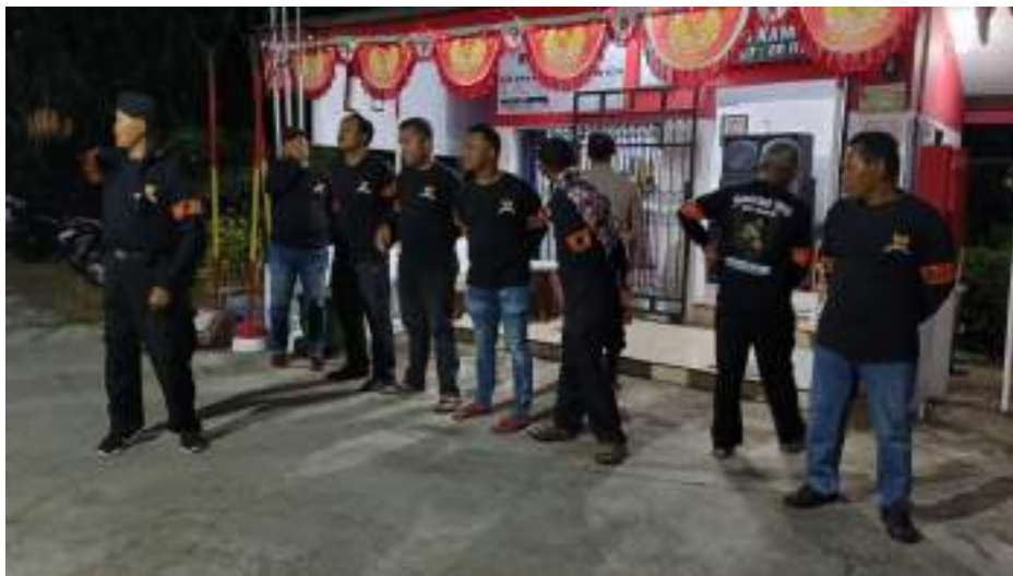
Monitoring Persiapan Lomba Siskamling