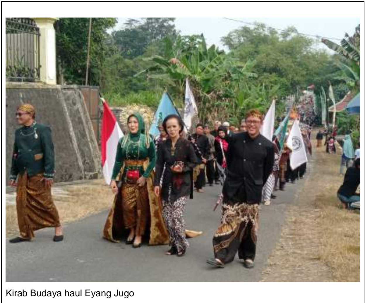
Kirab Budaya haul Eyang Jugo