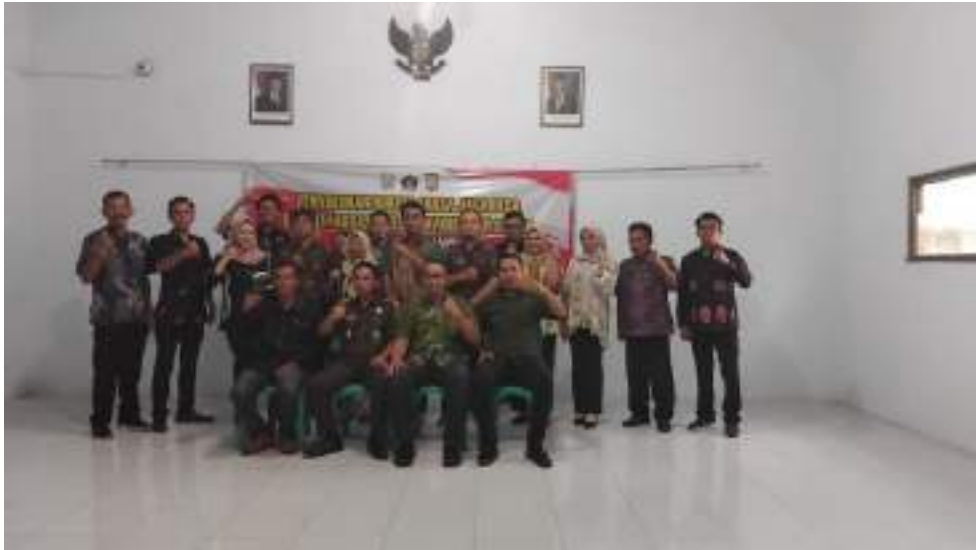
Penyuluhan Hukum Jaksa Jaga Desa