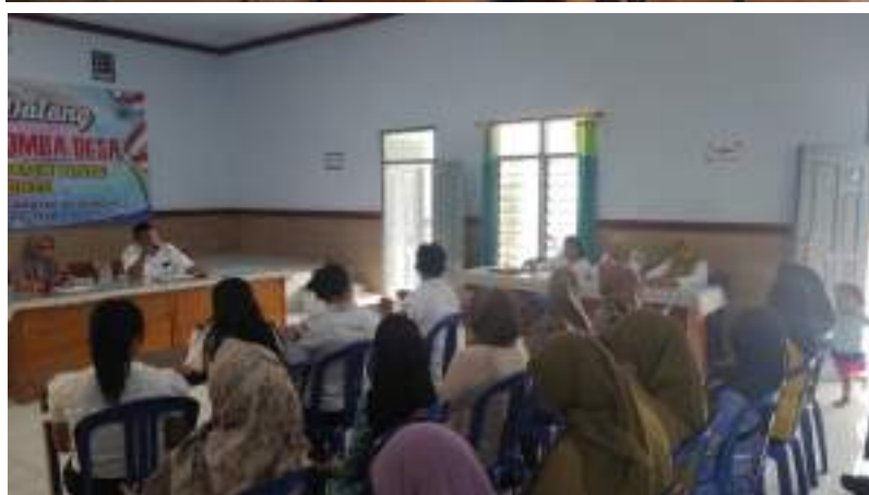
Pembinaan Lomba Desa, Desa Bumirejo, Desa Tapakrejo dan Desa Sukoanyar