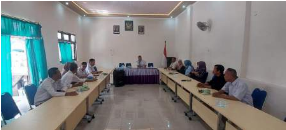
Rapat Koordinasi Bumdesma