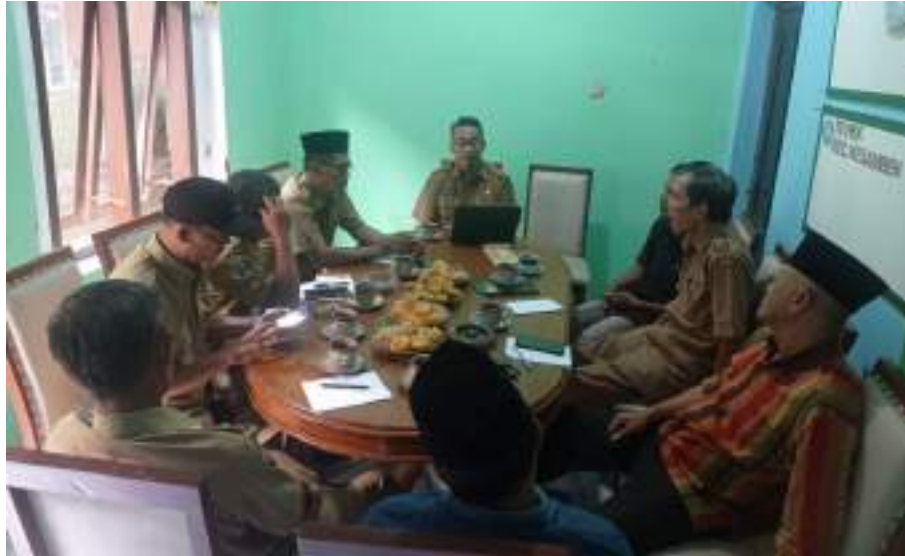
Rapat Koordinasi dengan Para Kepala Desa