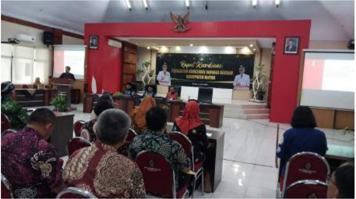
Rapat Inovasi daerah