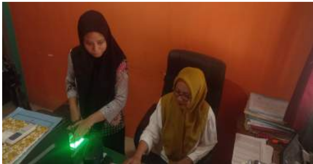
Pelayanan Rekam data bagi wajib KTP Pemula