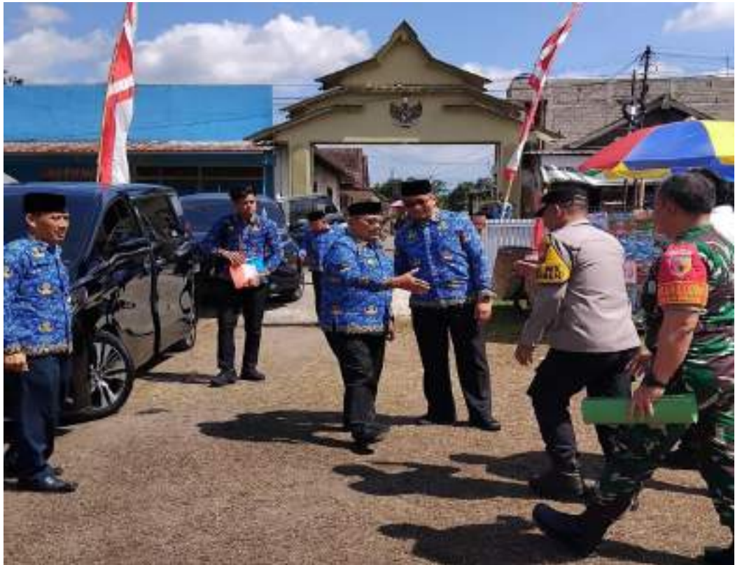
Kunjungan Bupati Blitar Ke Pasar Kesamben