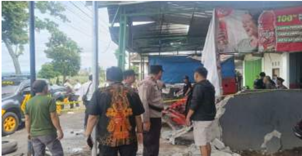
Evakuasi Korban Ledakan tabung gas bersama TNI/POLRI dan Warga masyarakat di Desa Siraman