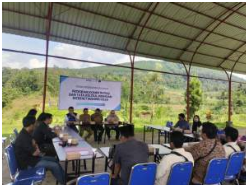
Bimbingan teknis tata kelola jaringan internet desa