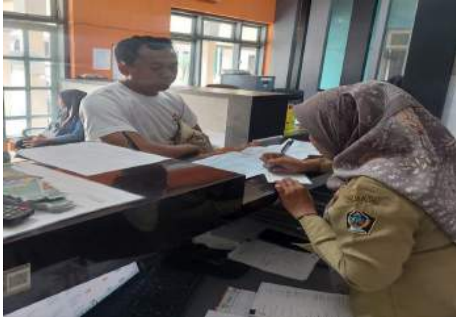
Pelayanan Surat keterangan Waris

Dokumentasi kegiatan sasaran meningkatnya kualitas dan jangkauan pelayanan publik sampai ke desa