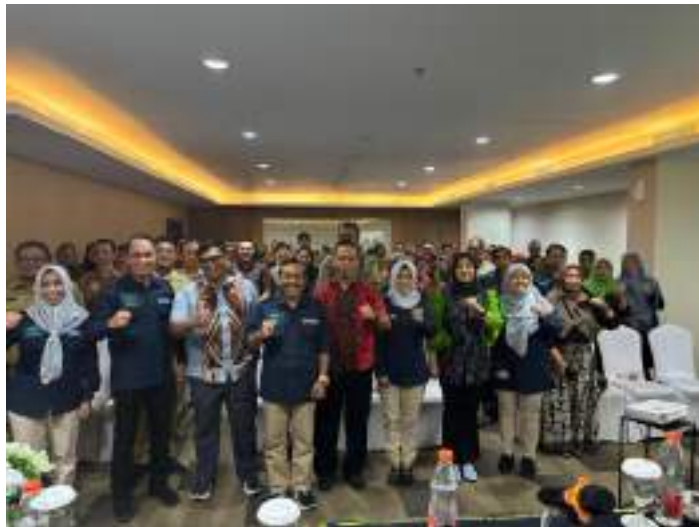
Kegiatan Desk TL APIP