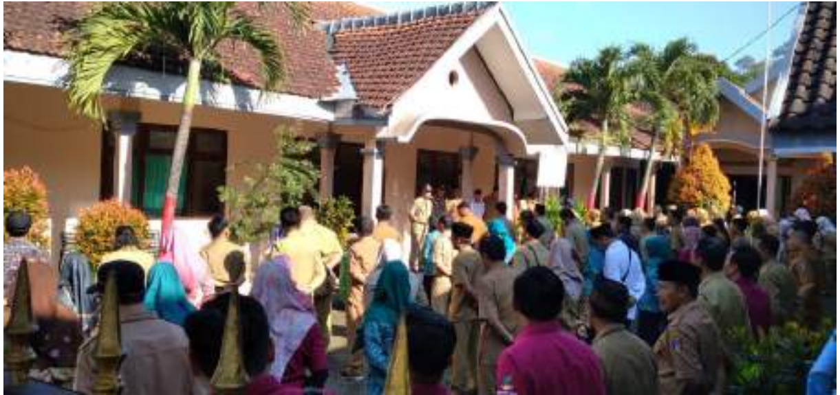
Halal Bi Halal Dengan Forkopimcam ,Semua Perangkat Desa Dan Instansi samping