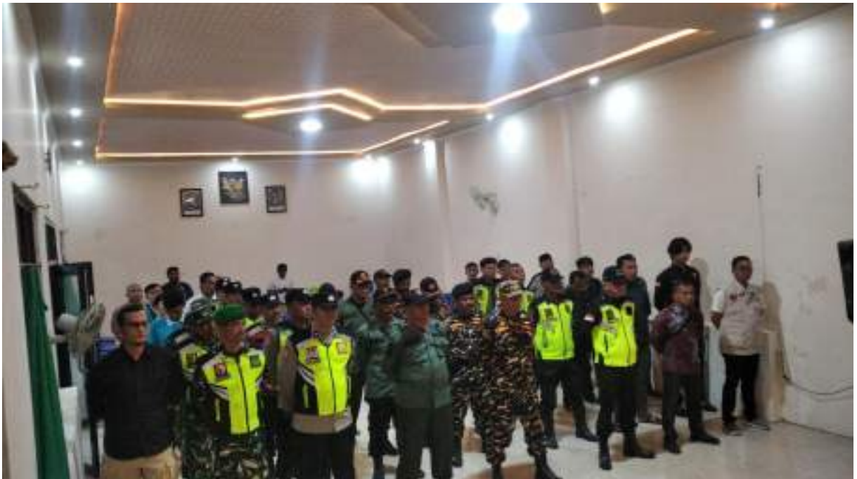
Apel dalam rangka pengaman Nataru