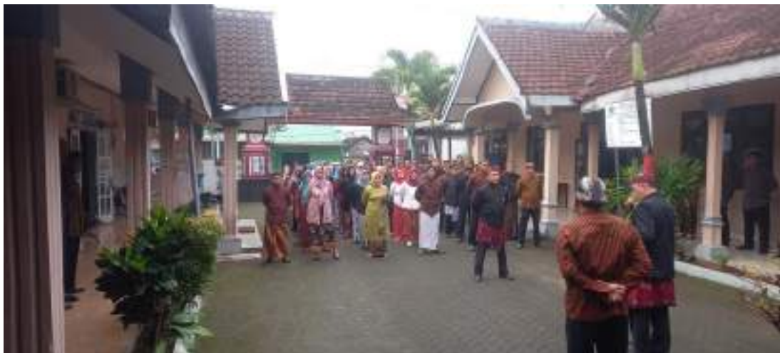
Upacara hari lahir pancasila