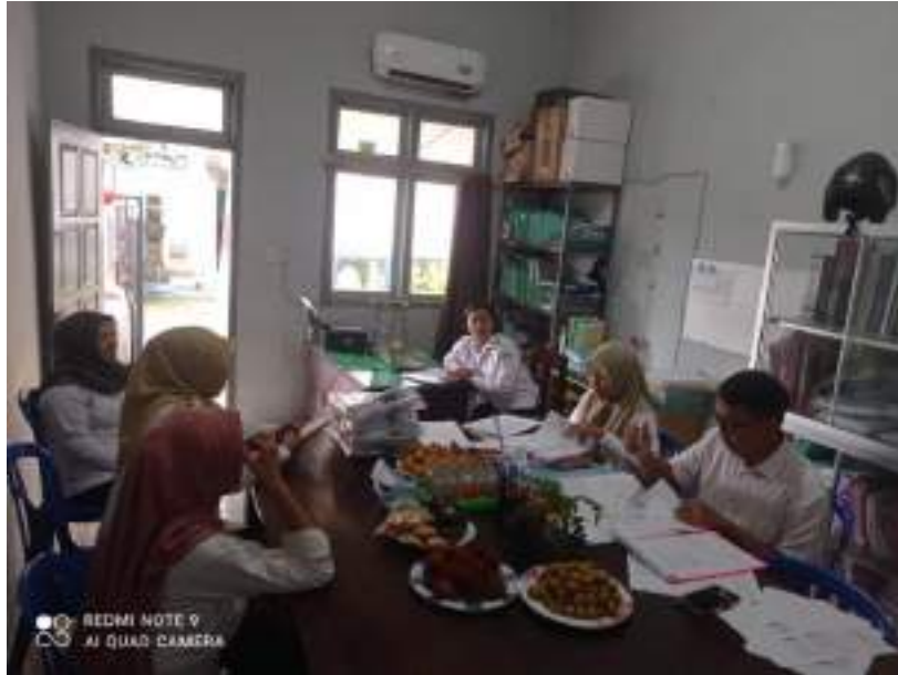
Review Laporan Keuangan