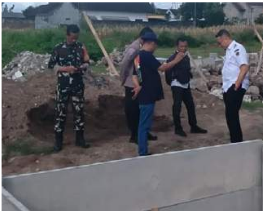
Peninjauan Lokasi pembangunan KDMP