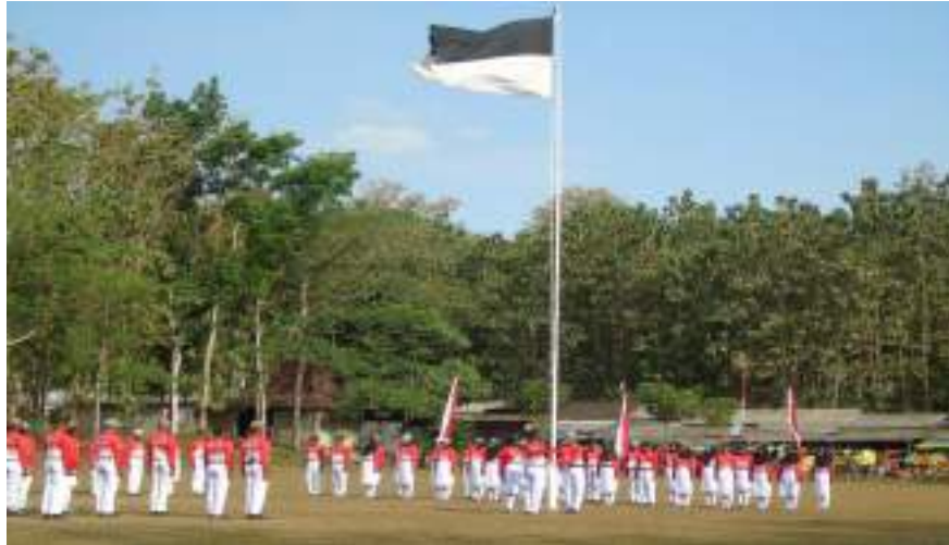
Latihan persiapan Upacara HUT RI