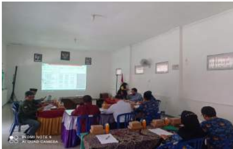
Evaluasi APBDesa Jugo