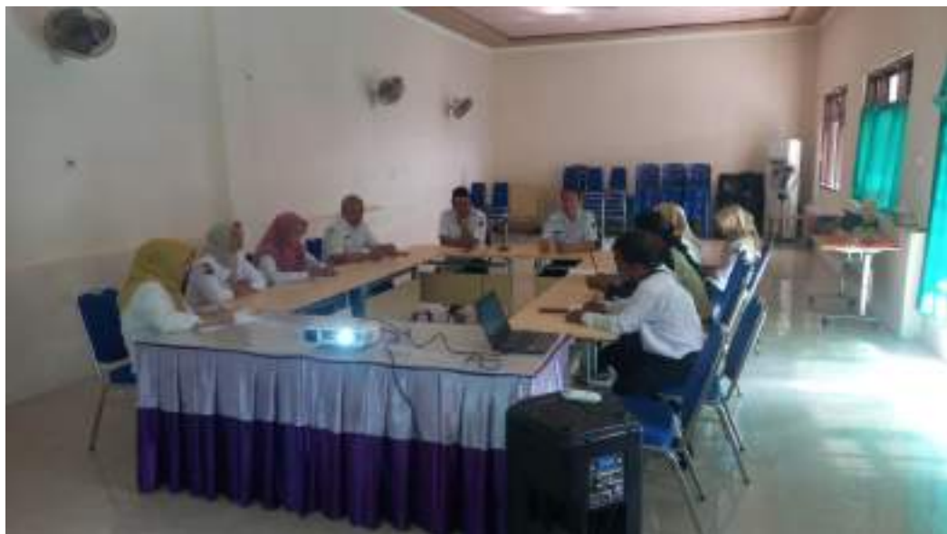
Rapat staf evaluasi Kinerja