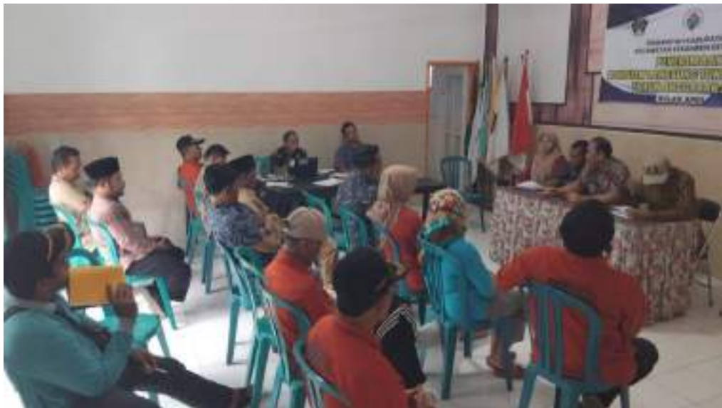
Evaluasi PBB P2