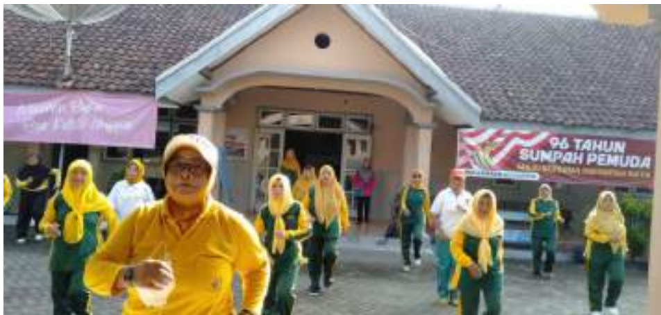
Kegiatan Senam Lansia Kecamatan Kesamben