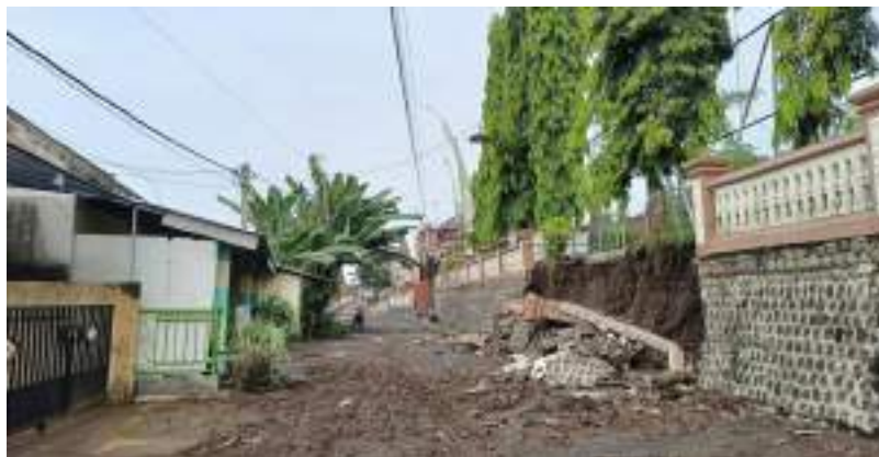
Memantau kejadian bencana angin puting beliung di desa jugo, bahu jalan ambrol di desa tepas dan Pagar Longsor di SMAN I kesamben