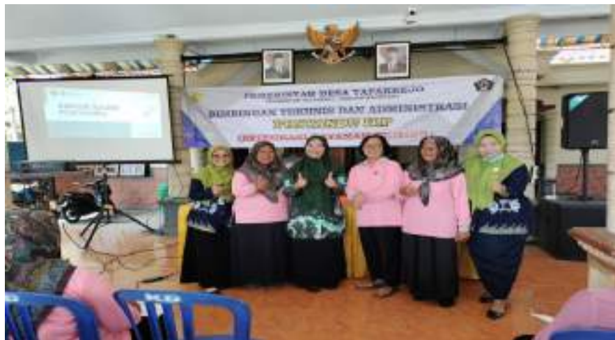
Kegiatan PKK Kecamatan