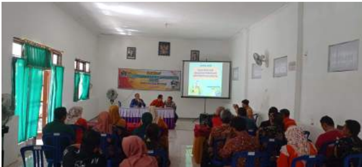
Sosialisasi PBB P2