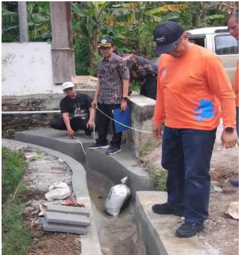
Kegiatan Opname Fisik