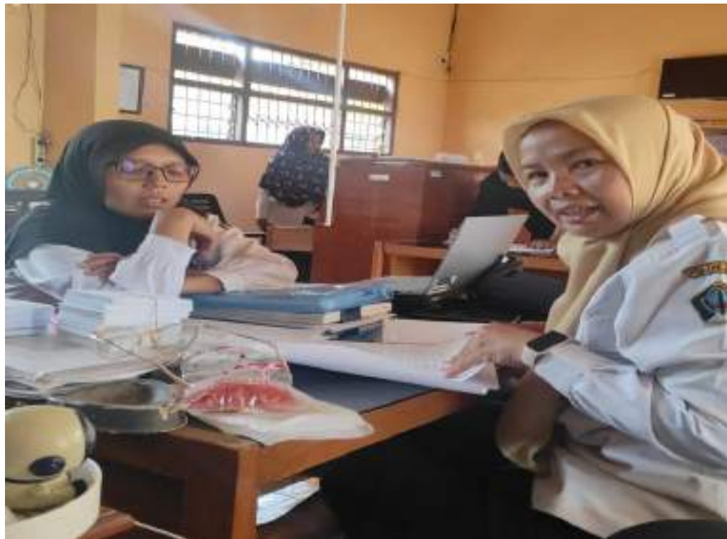
Monitoring Admindak desa Kesamben