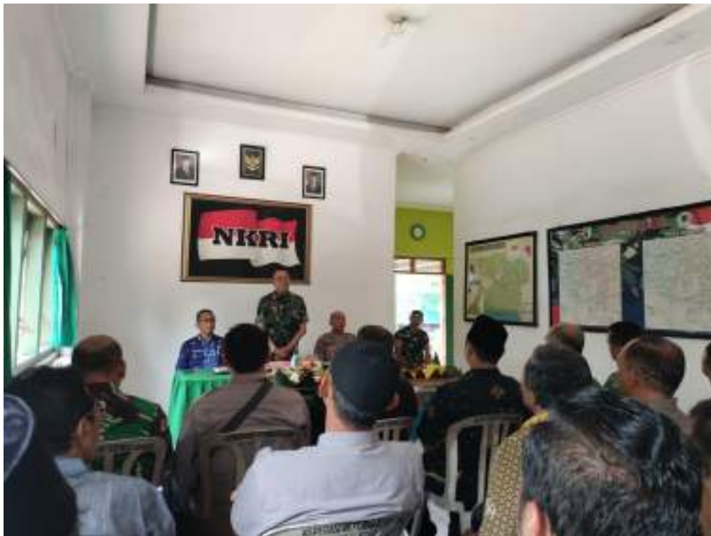
Pisah Sambut Danramil 0808/014